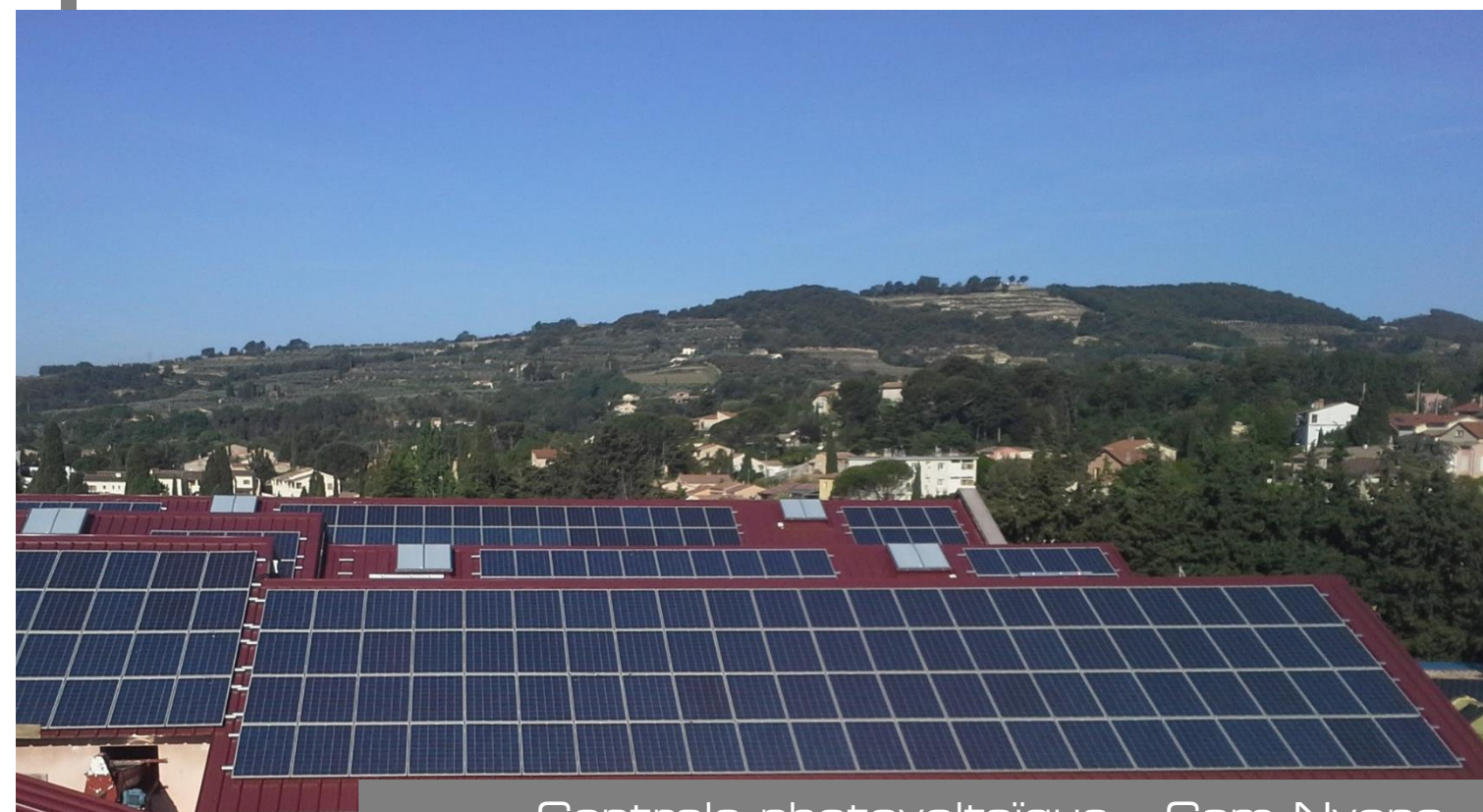
Centrale photovoltaïque « Cam Nyons »