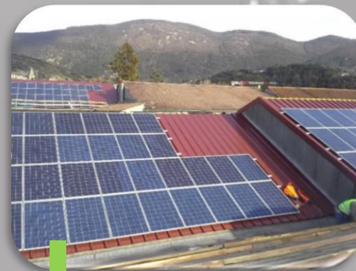
6 Raccordement des modules et mise en place des pièces de finition en toiture.