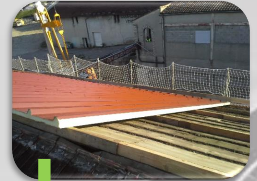
3 Recalage toiture à l'aide de chevrons bois et pose du bac acier isolé.