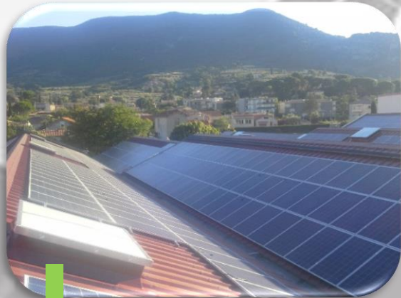
8 Centrale en fonctionnement.