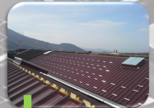
4 Mise en place du système d'intégration des panneaux photovoltaïques et des trappes de désenfumage.