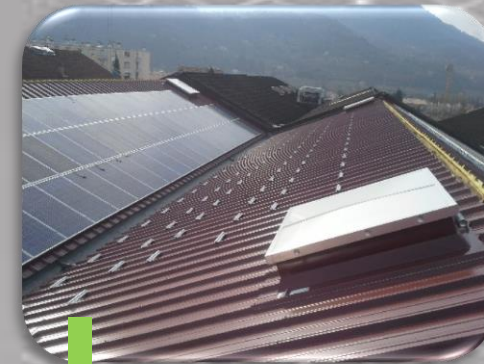
5 Installation des modules photovoltaïques en toiture.