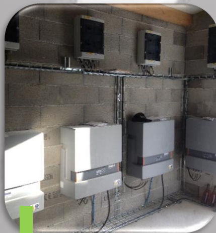
7 Local onduleurs, positionnement et câblages, jusqu'à l'accès réseau.