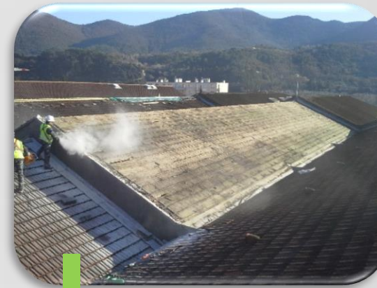
2 Découverte des toitures : Nettoyage de la structure avant pose du bac acier.